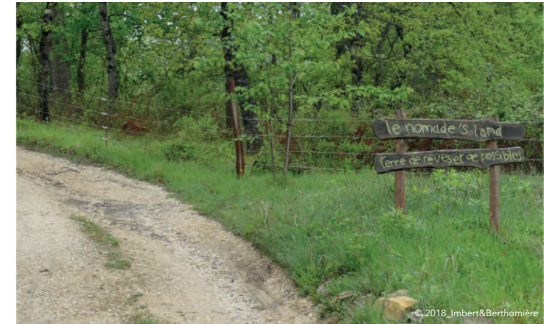
« Le nomade's land. Terre de rêves et de possibles » ◀ Crédit : Christophe Imbert et William Berthomière, mai 2018